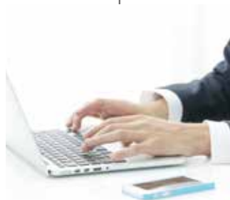
堅牢で柔軟な システムの実現