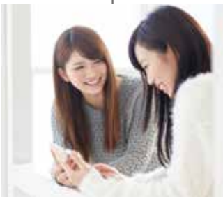
学生から教職員への 情報サービスの充実

入試広報システム 入試情報システム 学務システム キャリア支援システム 学納金管理システム 基本調査表作成支援 実習管理システム