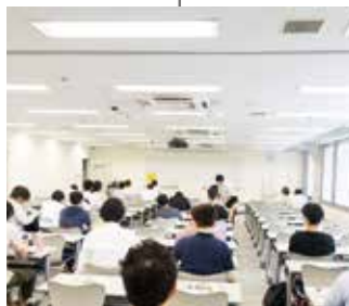
教育支援体制の 強化