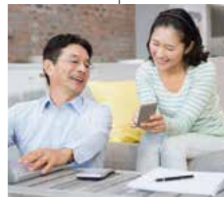
保護者への きめ細やかな情報提供